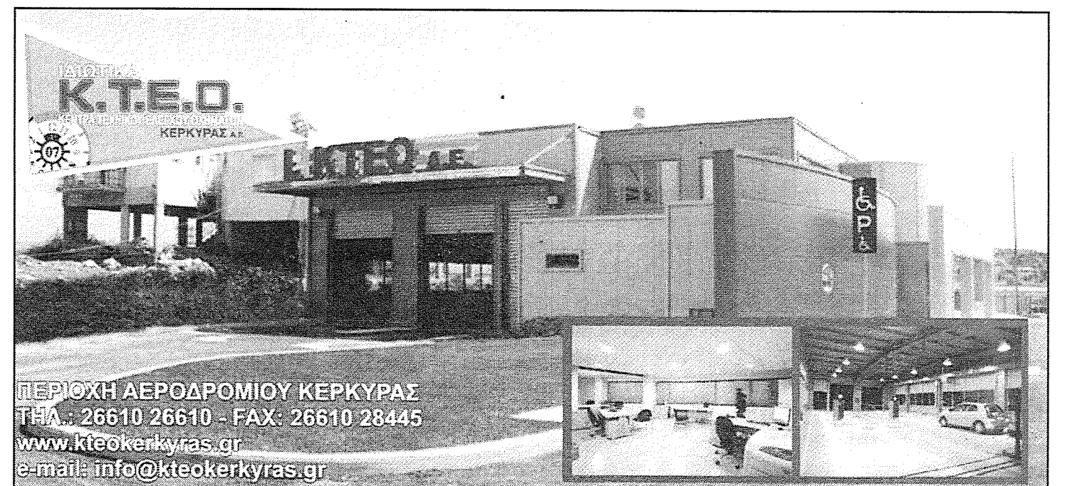
ΠΕΡΙΟΧΗ ΑΕΡΟΔΡΟΜΙΟΥ ΚΕΡΚΥΡΑΣ ΤΗΛ: 26610 26610 - FAX: 26610 28445 www.kteokerkyras.gr e-mail: info@kteokerkyras.gr