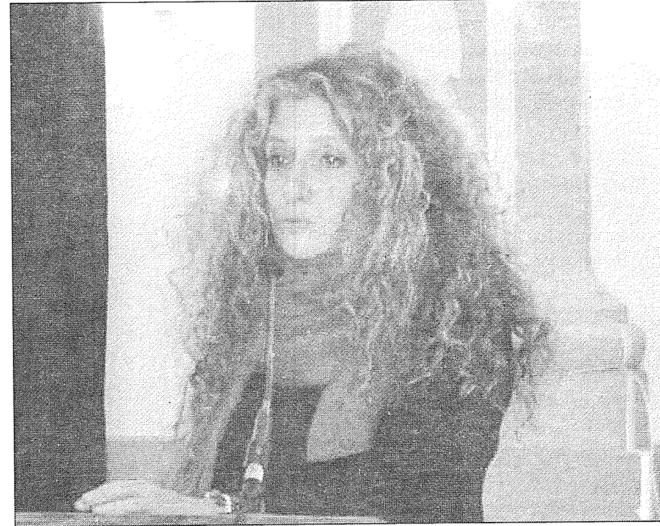
Η καθηγήτρια Ελένη Θεοδωροπούλου, Κοσμητόρισα στο Πανεπιστήμιο Αιγαίου με γνωστικό αντικείμενο στην Φιλοσοφία της Παιδείας

• Ναι, πράγματι, παραλλαγή αυτής της λογικής. Η έδρα αυτή είναι γαλλόφωνη και κατά τα ειωθότα, σύμφωνα